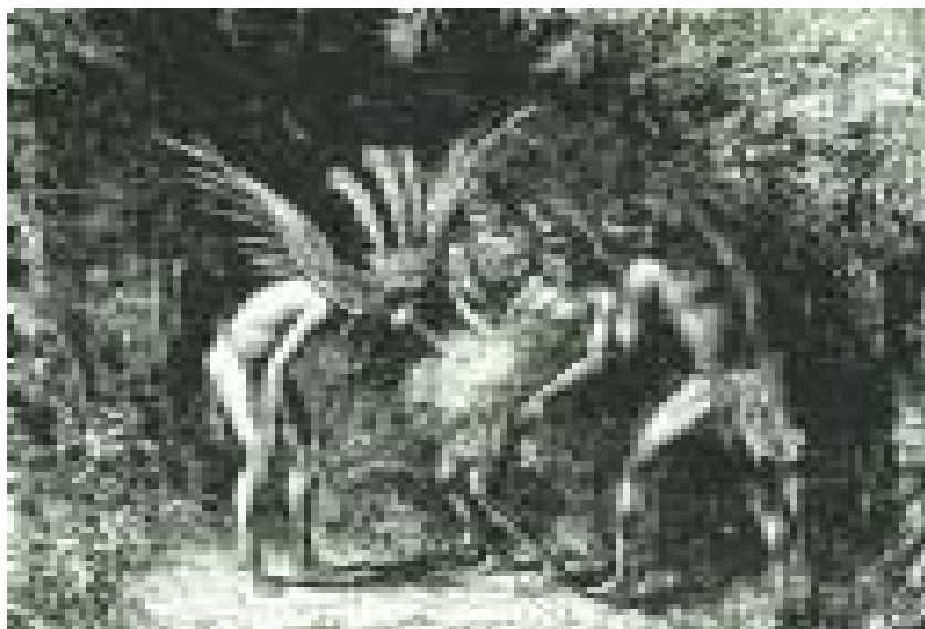
Ilustração: Jones Brothers Publishing Company

Lá começaram a vender a folha de tabaco para ser usada como fumo para cachimbo, rapé, para mascar e charutos até que, no final do século XIX começaram a industrializá-la na forma de cigarro. Em meados do século XX seu uso se expandiu devido ao desenvolvimento de técnicas avançadas de publicidade e marketing e sua disseminação nos meios de comunicação. No final da década de 60, começaram a surgir os primeiros relatórios médicos relacionando o cigarro às doenças dos fumantes e dos fumantes passivos. Atualmente, a Organização Mundial da Saúde (OMS) considera o tabagismo uma pandemia ou seja, uma epidemia generalizada, já que mata 5 milhões de pessoas por ano no mundo e, se nada for feito para controlá-la, este número poderá chegar a 10 milhões de mortes por ano em 2020.